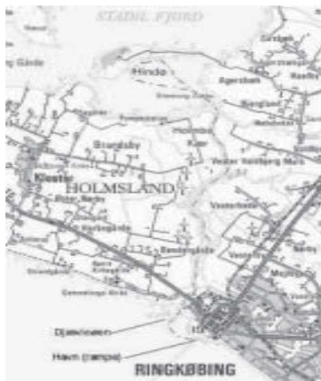
Kort over Vonåen

I flere år har jeg drømt om at genopleve en af mine drenges pragtfulde ture gennem det vestjyske landskab nord for Ringkjøbing. Søndag d. 1. september 2002 stod vores Wayfarer „RAS“ klar på traileren, og kl. 9.30 afgik vi mod Ringkjøbing havn. Min kone og jeg ankom ved slæbestedet i Ringkjøbing ved 11-tiden og satte straks båden i vandet.