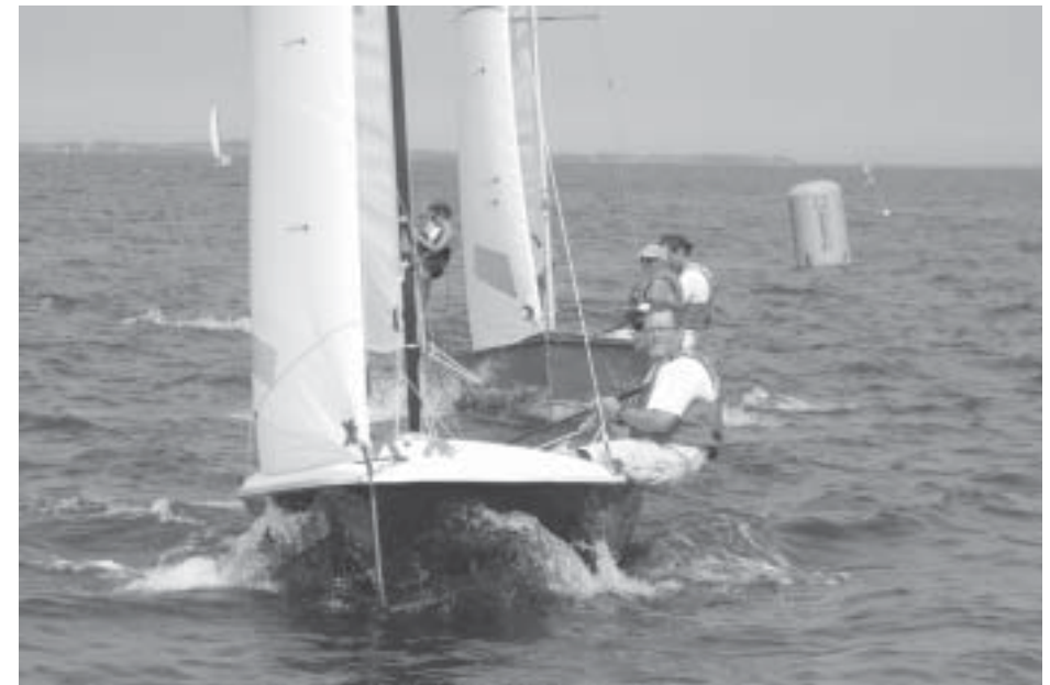
Fra DM i Hellerup 2003

Jeg foretog i vinter en undersøgelse blandt vore kapsejlere og fandt, at det var på tide at flytte dette mesterskab til andre himmelstrøg og til et andet tidspunkt. Harboe Cup tæller således i år ikke med som ranglistestævne, men det vil naturligvis være muligt at sejle det, hvis man ønsker. Der er tilmelding via Skælskør Amatør Sejlklubs hjemmeside.