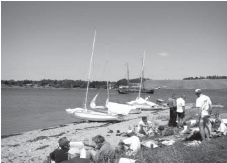
Vellerup Vig, Isefjorden

eller Bo Christensen, +45 39 68 03 30, bcr@dk.ibm.com