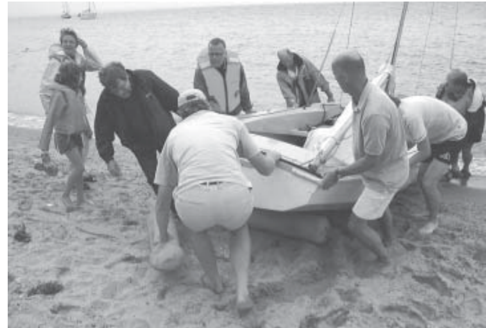
Ophaling af båd på Ven 2002

Hundige Havn. Hejren 30. 2670 Greve Strand. Tlf. 43 69 00 60 www.skovgaard-mortensen.dk • ove @ skovgaard-mortensen.dk