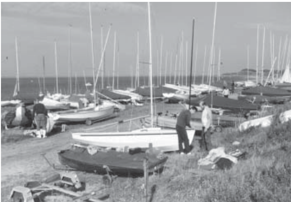
Fra Ho Bugt Sejlklubs jolleplads

Til enhver tid at komme frem med ideer, inspiration og initiativ er det bedste grundlag for SWS' fortsatte udvikling. Ideer rettes til en i et udvalg eller i bestyrelsen. Nogle beslutninger skal tages af SWS højeste myndighed: generalforsamlingen. Her har vi et punkt på dagsordenen: Indkomne forslag. For at sikre ordentlig behandling skal vi gerne have forslag inden vores næste bestyrelsesmøde sidst i maj.