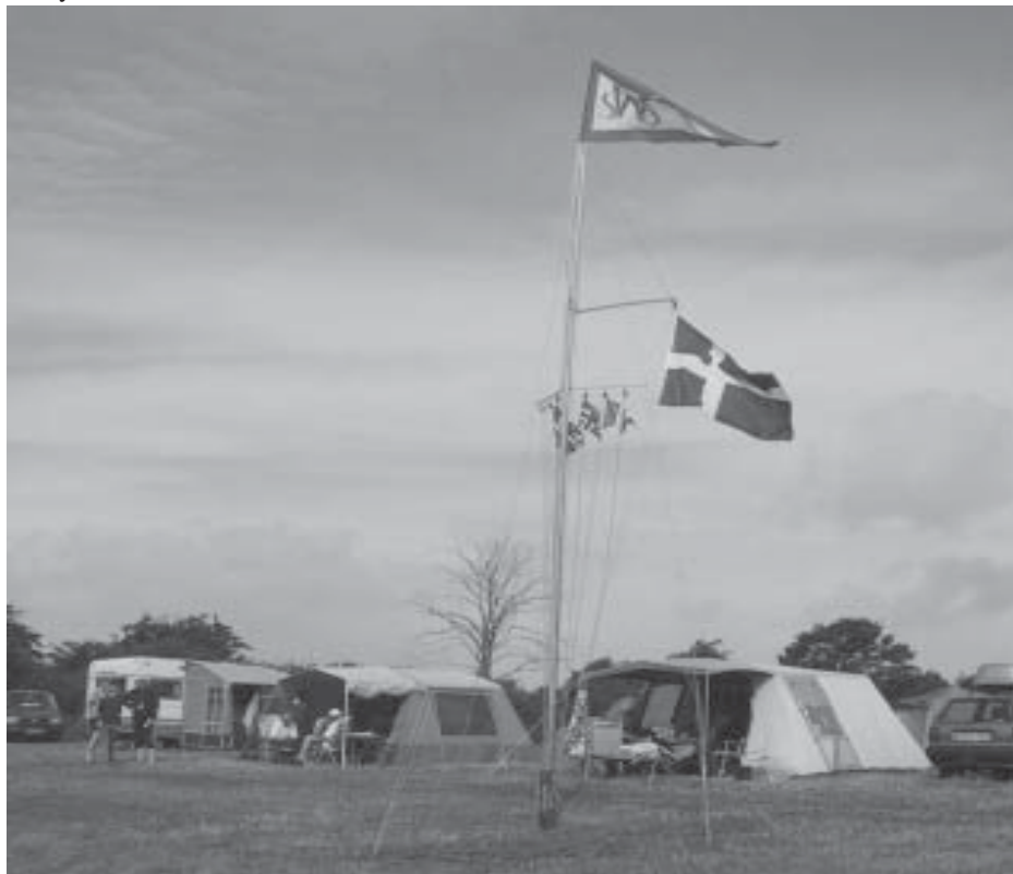
Fra Rantzausminde