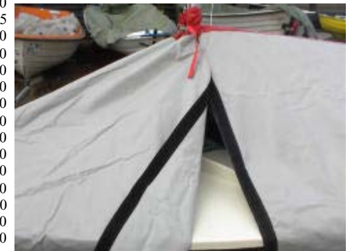
Sideåbning med velcrolukke