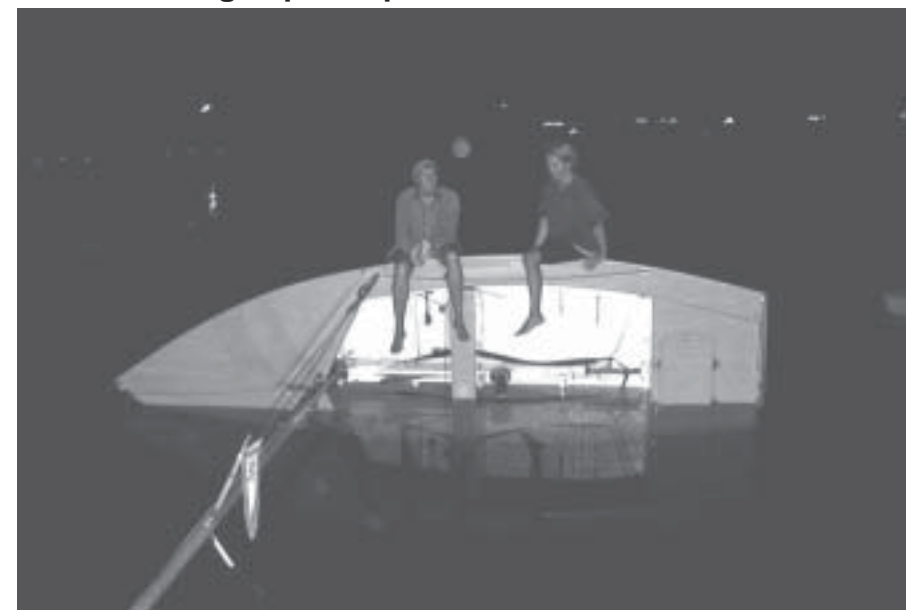
Opdriftsprøve by night