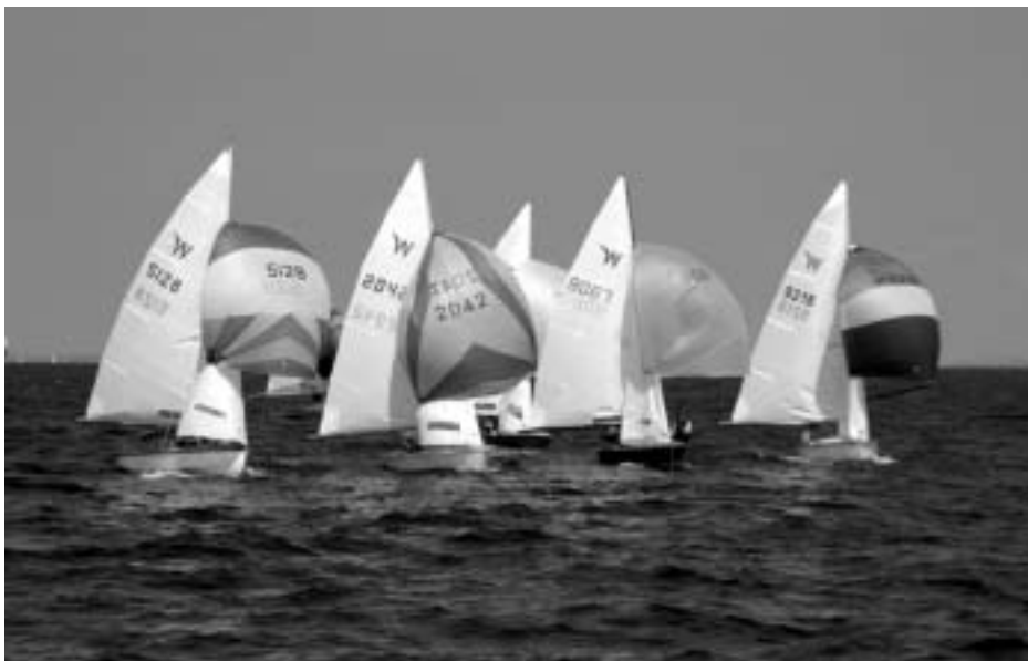
Fra DM 2003 i Hellerup