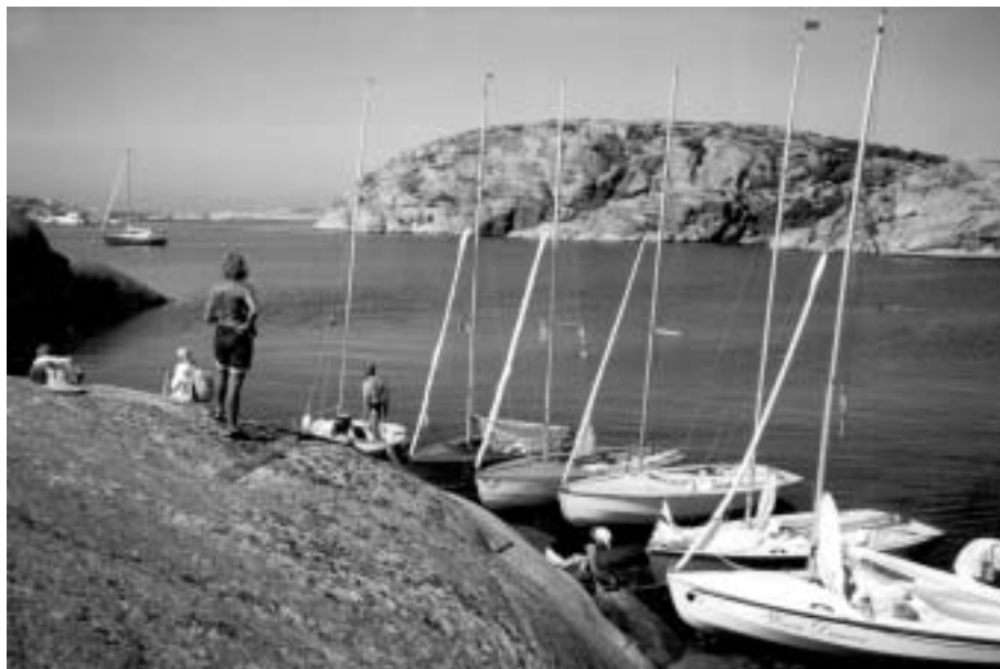
Storön, Int. Wayfarer Rally 2003

Turen hadde vi beregnet til 2 dager. Det var ca. 56 n. m. En herlig morgen kl. ble 0915 løsnet vi fortøyningene. Værmeldingen hadde lovt oss sør/vest vind det passet oss fint.