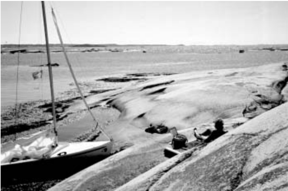
Wave-Dancer og Vipse på Kockholmene

Dagene efter gik turen til Græsholmene og sydpå til Härmanö for at slutte med større tur ind i landet gennem smalle fjorde til Bassholmen, hvor vi fik frokost og så på museet. Videre gennem smalle fjorde til Fiskebackskil (lige syd for Lysekil) og en lang tur hjem langs med kysten sydover, medens skyerne trak mistænkeligt sammen om solen, luften blev lidt køligere og et vejrskift synes på vej. Barometeret faldt og vi tog hjem et par dage efter træffet sluttede.