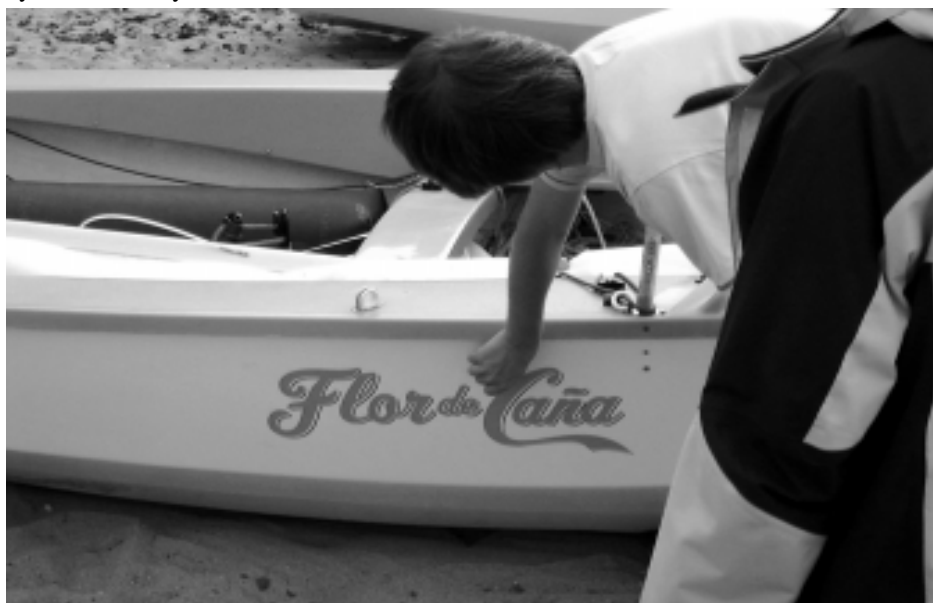
Båddåb 2002

Tilrejsende med eller uden båd kan aftale nærmere med kontaktpersonen for en af de lokale fleets i Øresund. De kender også mulighederne for søsætning og kan eventuelt skaffe gasteplads til tilrejsende.