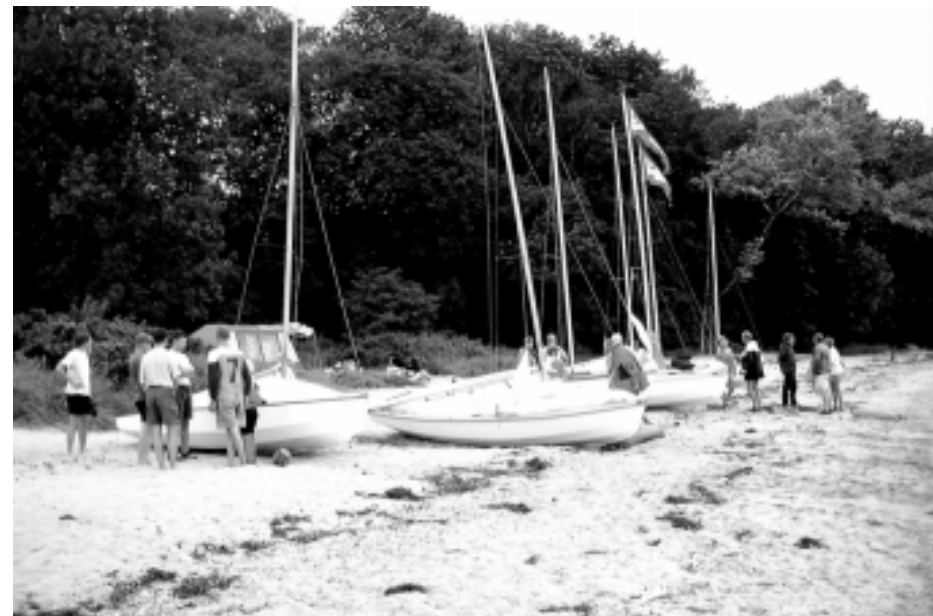
Fra Ven 2002

Har du Wayfarersangbogen på din pakkedisse? Er du i tvivl om noget, kan du få hjælp hos en erfaren Wayfarersejler.