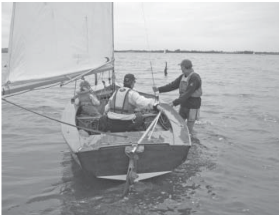
Sejlads med Tvillingerne i W239 fra Rantzausminde