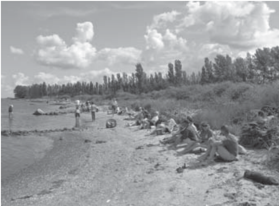
Glade sejlere på stranden på Lilleø

De fleste bryder op og traver en tur over til Askø.