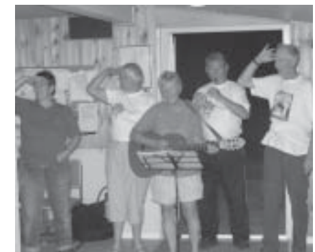
Musik til Wayfarersange

En sidste gang synger vi Wayfarersangen inden standeren hales ned. Vi går hen til hytten for at pakke vores sidste ting ned og går derefter rundt for at sige farvel. Klokkeren 12 trillede vi ud af pladsen med en masse gode oplevelser i bagagen.