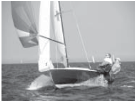
Quentin Strauss og Rachel Rhodes i 7588-Scavenger

Aftenens arrangement var grill middag og uddeling af gimmicks for individuelle præstationer i form af Nutella, T-shirts og termotøj.