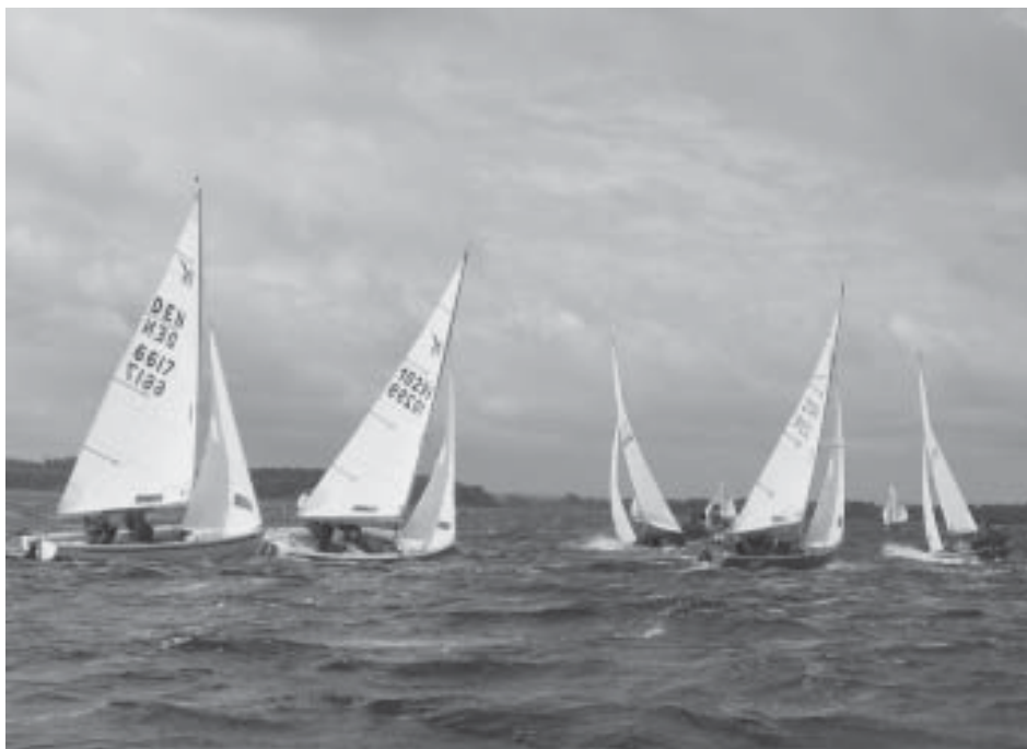
Situation fra DM 2007