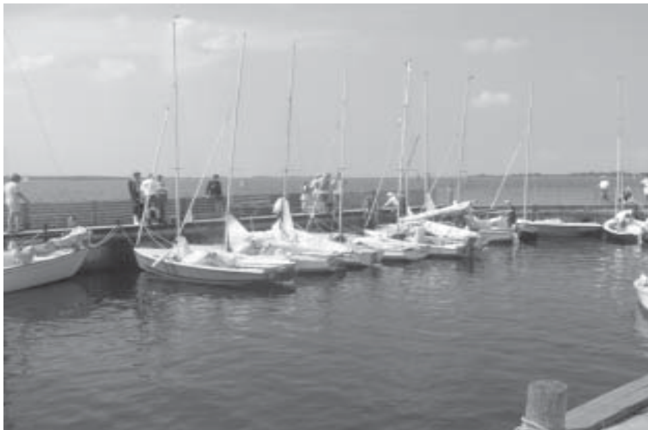
Joller i Skalø havn

tur med godt med slæk på skøderne i det mest pragtfulde solskin. Vi anløber alle den lille havn – 17-18 joller – dejlig trængsel. Kun Kantarellen vælger at gå på stranden. Her er pålandsvind.