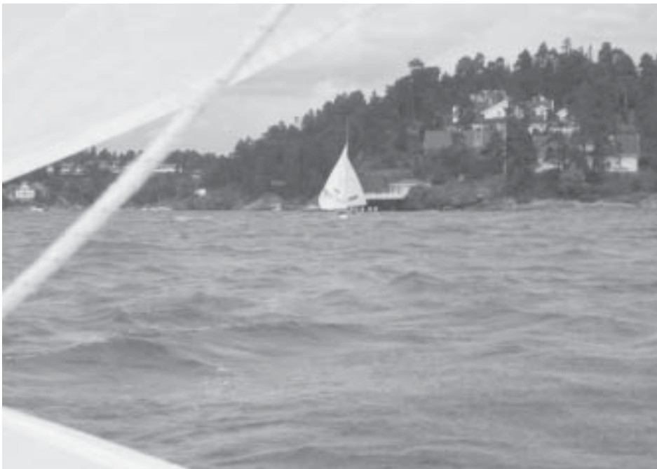
W1348 mistet storseilet ved kantring dagen før. Ses med spilet genoa om SB, og om BB „W-trysail“, med kryssfokk under, som leseil, på vei inn i hjemlig farvann, vind ca. 10-12 m/sek - liten kuling på Norsk.