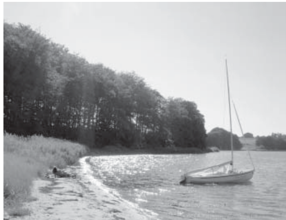
Sommer i Smålandshavet