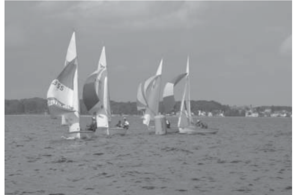
Fra DM i Hellerup 2003