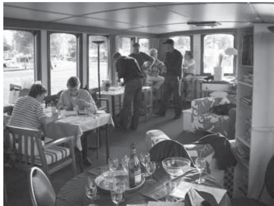
Der var hygge i „In Dubio“

Denne personlige beretning er også for at understrege, at hvis der skal flere end 10 wayfarersejlere til race, er det vigtigt, at der også indgår momenter, som kultur f.eks historiske miljøer, gallerier, hyggelige spisesteder, og at man undgår primitiv indkvartering, sovesale osv.