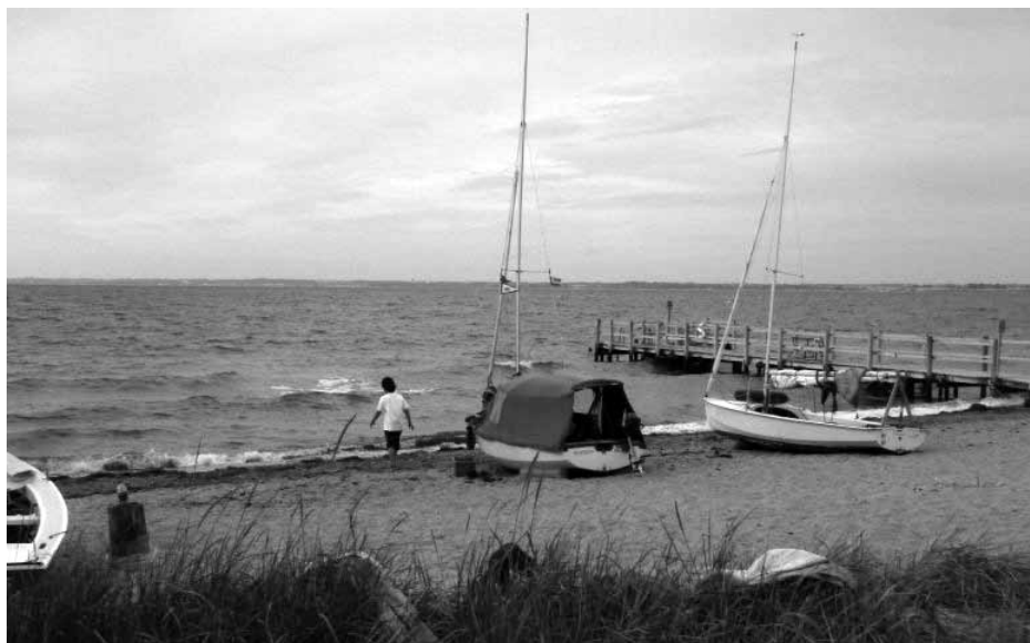
Norrebrog strand i pålandsvind

På vei hjem, ut forbi Trekroner Fort, passerte et svensk marinefartøy oss, også et norsk var til stede, og så ble det 3 timer med X-på-X mot strøm og frisk bris til hjemmehavn. Med mini- ell. flatrev og godt strammet Cunningham hadde vi fint driv og balanse som akkurat passet til oss to. Nok en fin W-opplevelse.