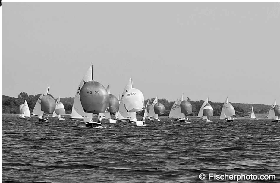
Fra DM

med eftertryk. Først hen ad kl. 3-4 ebbede støjen ud og vi kunne få lidt søvn. Da vi skulle være klar og på mærkerne tidligt næste morgen betød det, at vi fik ca. 3 timers søvn. Ikke meget at skulle koncentrere sig på..