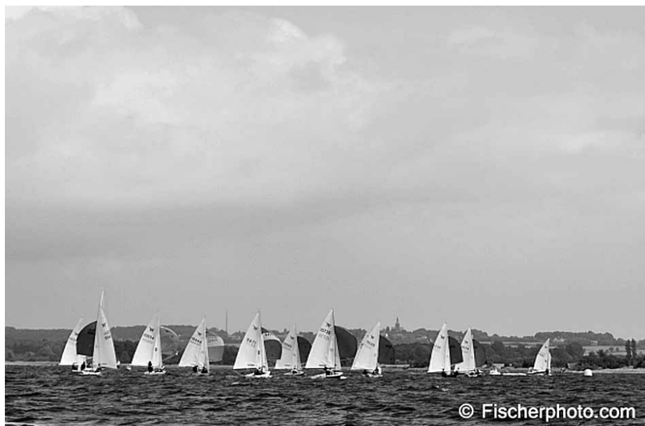
Fra DM i et af Danmarks smukkeste farvande

Et stævne der bød på mange fine sejlads, som følge af et velforberedt arrangement i et af danmarksmukkeste farvande.