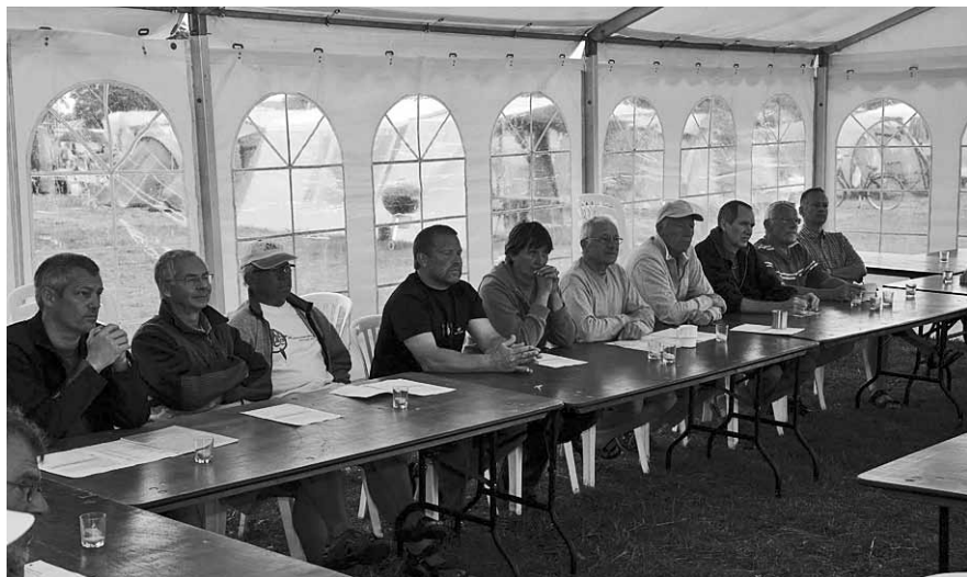
Fra generalforsamlingen

Dirigenten konstaterede, at der ikke var flere, der ønskede ordet og gav ordet til formanden, der takkede for en god og konstruktiv debat og afsluttede generalforsamlingen.