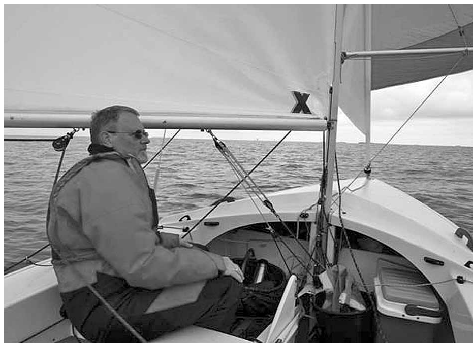
På vej sydover mod Kyholm inden byen !!