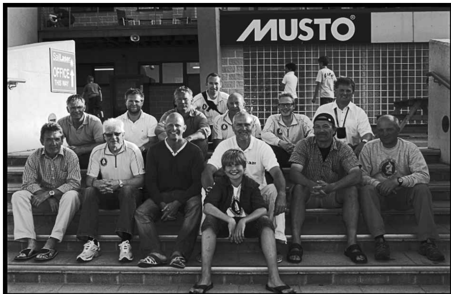
Hele DM holdet i Weymouth

Siden hjemkomst har vi tit talt om, hvor den næste mulighed kan opstå for at få afreageret i en stor kapsejlad. Det bliver sikkert i Holland til næste sommer. Ugen i Weymouth var en kæmpe oplevelse, hvor en af de vigtigste erfaringer var, at det simpelthen bare gælder om at kaste