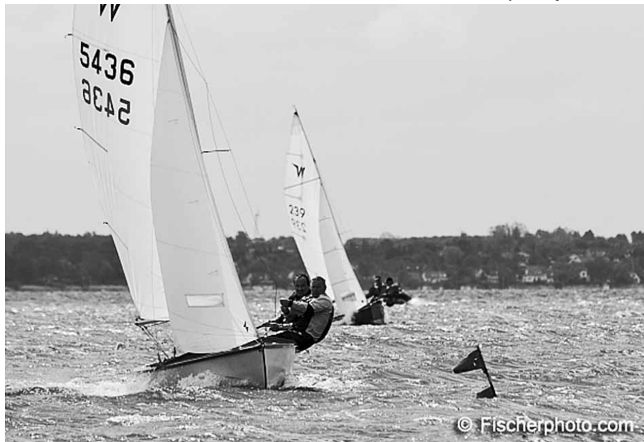
Fra Præstø stævnet

I ønskes alle en god aktiv vintersæson med reparation, klargøring, kapsejls teori, træning og måske også en fed solskinstur december i Wayfarer jollen.