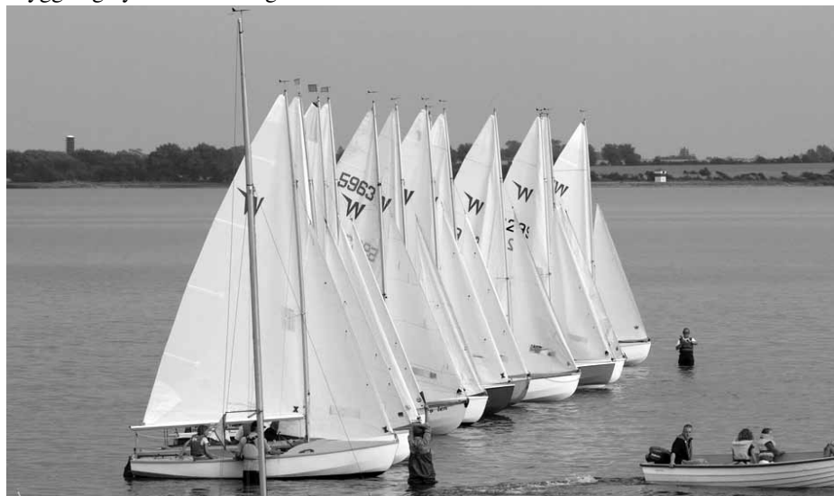
Starten Rantzausminde kapsejladsen

Traditionen tro var der kæmpefest om aftenen med grill, billige gode vine, kaffe, dans og musik til langt ud på natten. Vejret var jo også traditionen tro i sit bedste lune og en flot solnedgang kunne nydes fra middagsbordet i teltet som næsten fylder hele midtermolen. Ingen tvivl, det er landets bedste arrangement for specielt Wayfarer idet der er lagt vægt på lidt sejlads og en masse socialt. Ved præmieuddelingen lovede vi at stille med mindst 15 Wayfarer til næste år, da det er en oplagt W sejlads hvor det sportslige ikke er det primære. Bare det at deltage er i sig selv en oplevelse værd. Book allerede nu den første weekend i juni måned 2011, der kører det igen løs med dette fantastiske stævne. Det er første gang i mange år hvor deltagelsen har være så ringe. Det må vi lave om på.