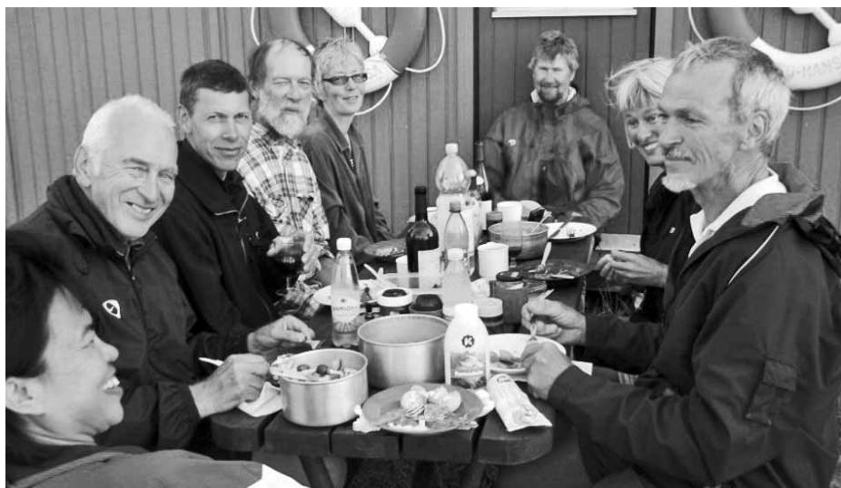
Deltagerne på Ven tråffet 2010

Under opp-greining så vi plutselig 4 av 5 Sletten-W-joller dra hjemover. Varsel