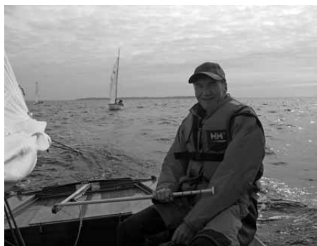
Kurs hjem mod Ordrup Næs

På hjemturen løjede vinden støt mens vi sejlede mod Ordrup Næs og der blev rebet ud. Ved stranden ud for sommerhuset blev ”chaufførerne” landsat. De skulle køre trailere om til slæbestedet medes vi andre sejlede jollerne rundt om næsset, idet vejrudsigten for lørdag var med hård vind og regn og søndag også var noget usikker.