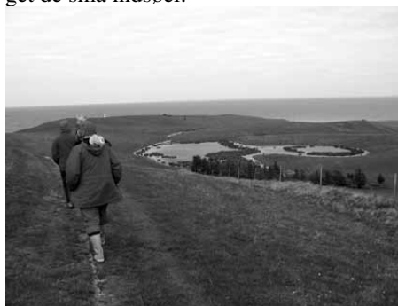
Der skal være klokkefrøer i den lille sø nedenfor bakken

Klokkefrøerne svigtede os denne gang, måske fordi mågerne i tusindtal har indtaget de små indsøer.