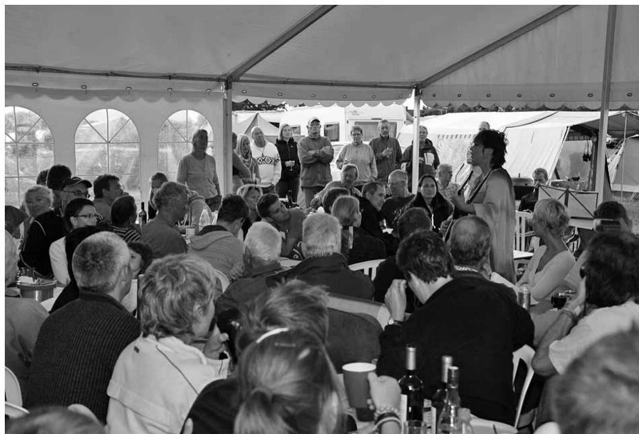
Fra fællesteltet i Rantzausminde 2009