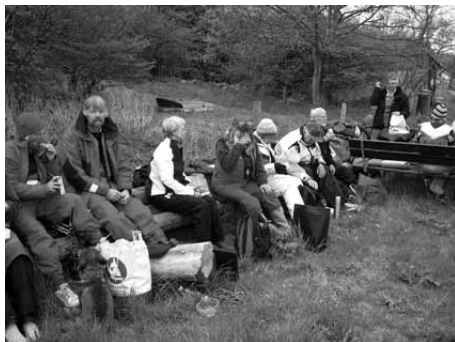
På stranden ved havnen på Nekselø

Nu var tiden inde for en vandretur på nordenden af øen, hvor vi havde forventninger om, at vi skulle høre klokkefrøer.