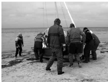
Søsætning fra stranden

Torsdag eftermiddag søsatte vi jollerne ved del lille bådelaug, som ligger for enden af Højbjergvej inde i bugten øst for næsset. Her er et fint slæbested og bådebro, som man kan benytte for 35 kr. Der er også en god stor parkeringsplads, hvor man kan rigge til før søsætningen.