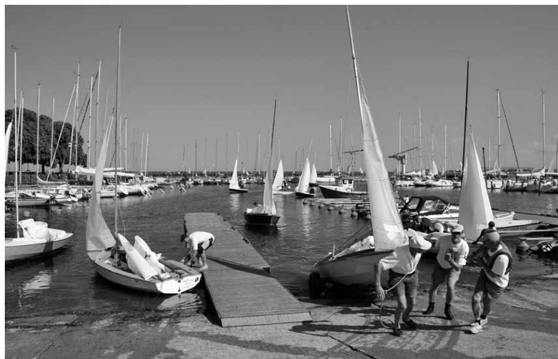
Hellerup Havn