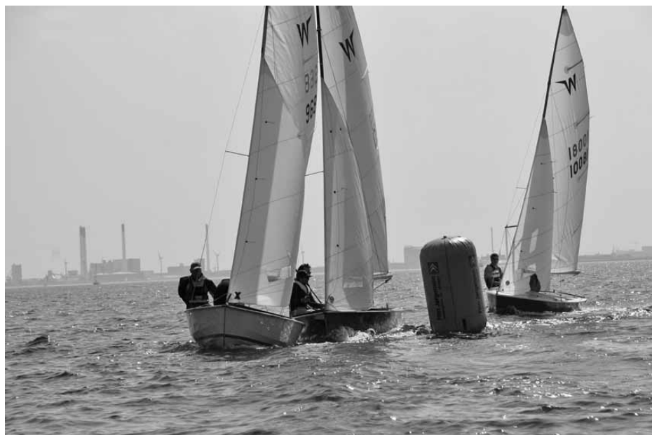
Fra VM 2007 i Hellerup

Til sidst en stor tak til Hellerup for et godt stævne – vi kommer igen til september og kontrollerer, om Wayfarerjollerne på havnen har været rørt, siden vi var der sidst. Inden da mødes vi i Præstø, Svendborg og Roskilde, ligesom en del af jollerne mødes med andre i England i juli for at sejle Wayfarer Worlds 2010.