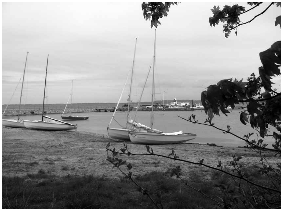
Joller på stranden ved havnen på Nekselø