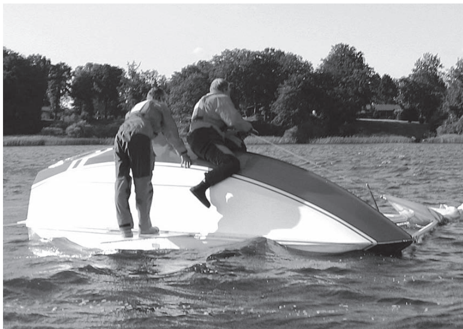
En spilerkæntring klares hurtigt med øvelse