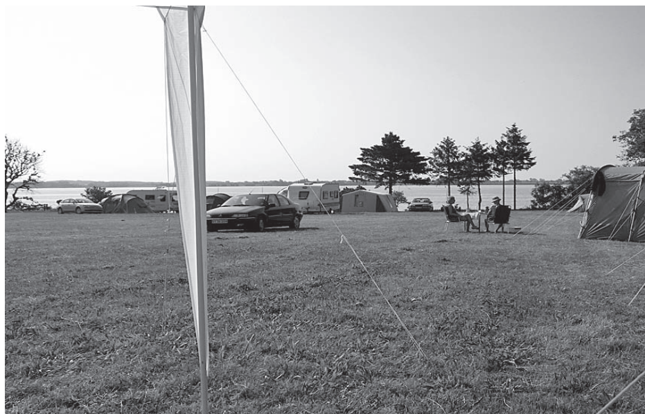
Rantzausminde før start af træffet 2009

Ved middagstid er vi klar til at sejle, og beslutter os for en tur Skarø rundt. Solen skinner og vestenvinden er jævn. Sejladsen og livet er vidunderligt. Da vi er halvvejs rundt om øen, frisker vinden og vi får en superfin læser hjem. Da vi