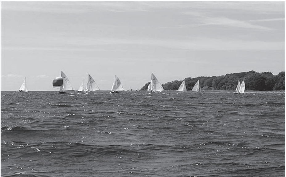
Kapsejlad ved Rantzausminde

Reserver d. 3 og 4. juli 2010 til DM i Svendborg Sunds Sejlklub!