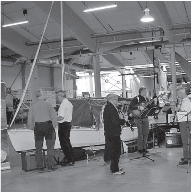
Wayfarer Stompers i Bella