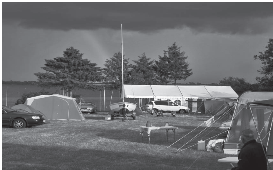
Torden over Tåsinge

Da vi kommer tilbage, kommer de joller der tog til Fjællebroen tilbage. De har haft en fin tur.