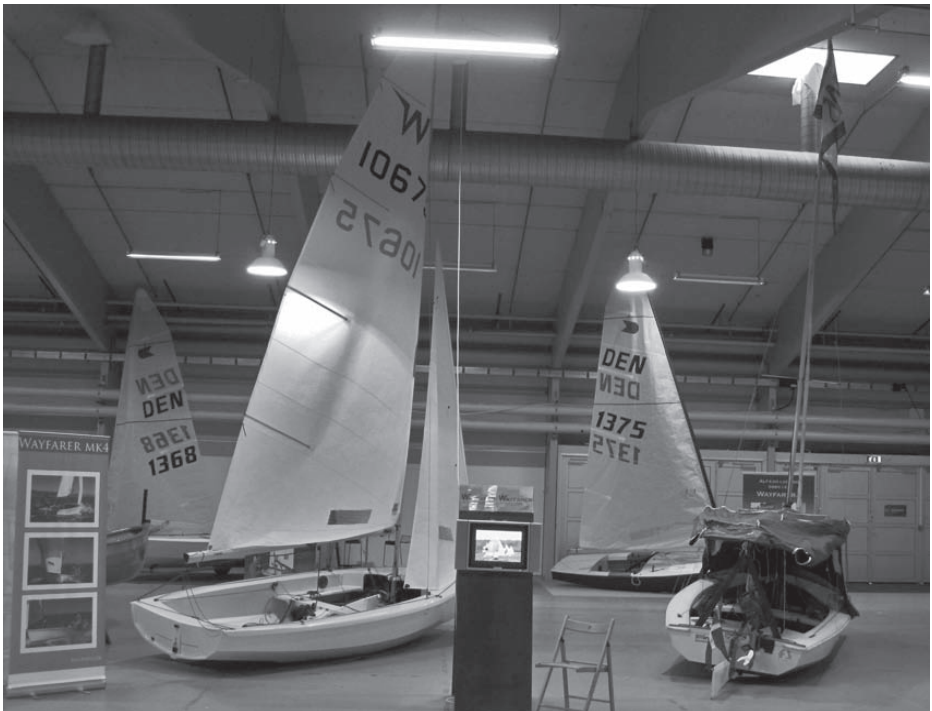
MK4 og MK1a på Bådudstillingen i Bellacenteret

Klassereglerne vil meget snart blive gjort tilgængelige på vores hjemmeside, på engelsk i eksakt ordlyd, og hvis der er spørgsmål kan du altid rette henvendelse til undertegnede eller en af de andre målere.